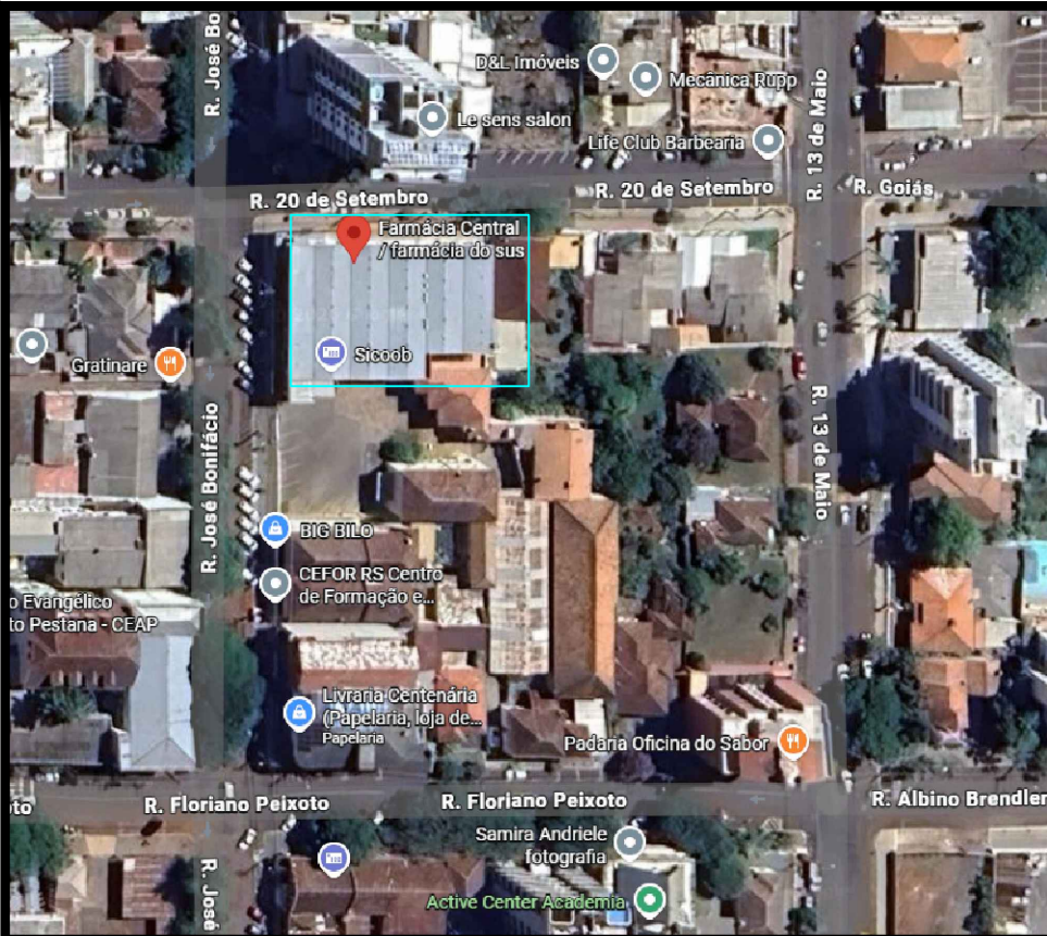
LOCALIZAÇÃO Sem escala